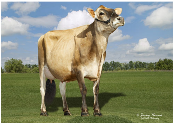
PROGENESIS BNCROFT DEJA GRANDDAM