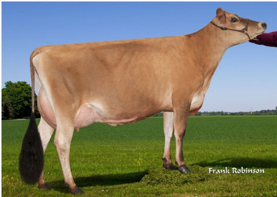
PROGENESIS DUCHESS DAM