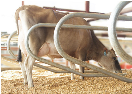
PROGENESIS BNCROFT DEJA GRANDDAM